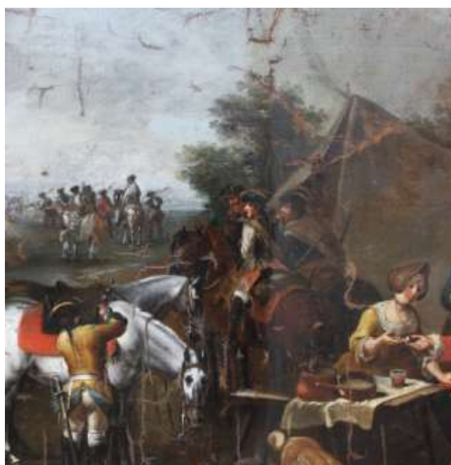
19. kép (félbetisztított állapot)