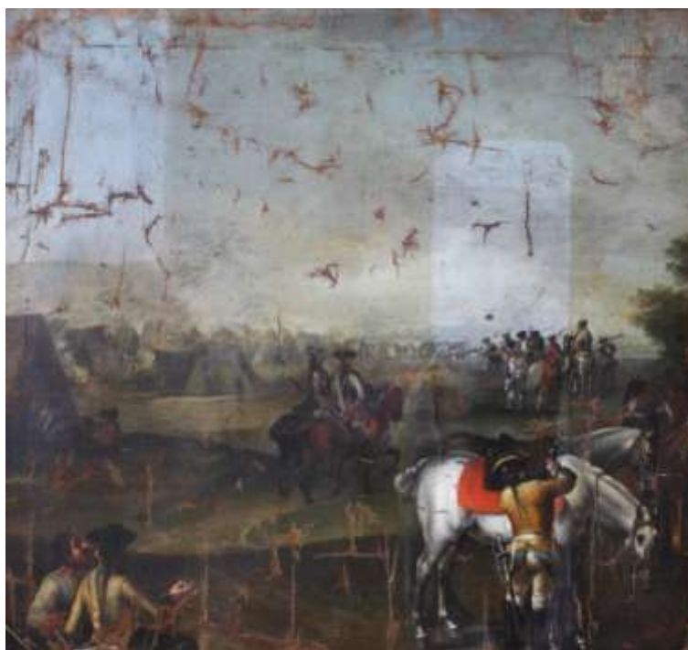
18. kép (tisztítóablakok)