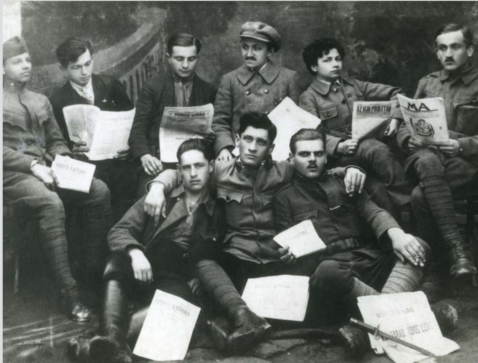
Aszódi vöröskatonák, 1919 Red soldiers from Aszód, 1919