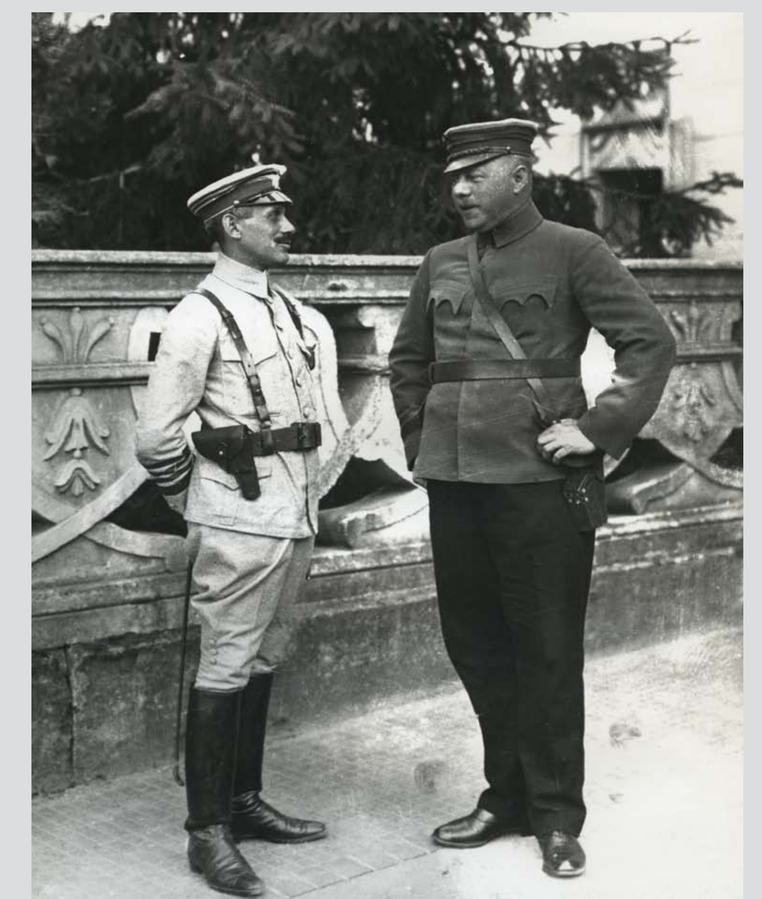
Böhm Vilmos, a Hadügyi Népbizottság elnöke és Stromfeld Aurél, a Vörös Hadsereg vezérkari főnöke. Gödöllői főhadiszállás, 1919 tavaszán Head of the Military Commissariat Vilmos Böhm and the Hungarian Red Army's Chief of Staff Aurél Stromfeld at the Gödöllő headquarters, spring of 1919