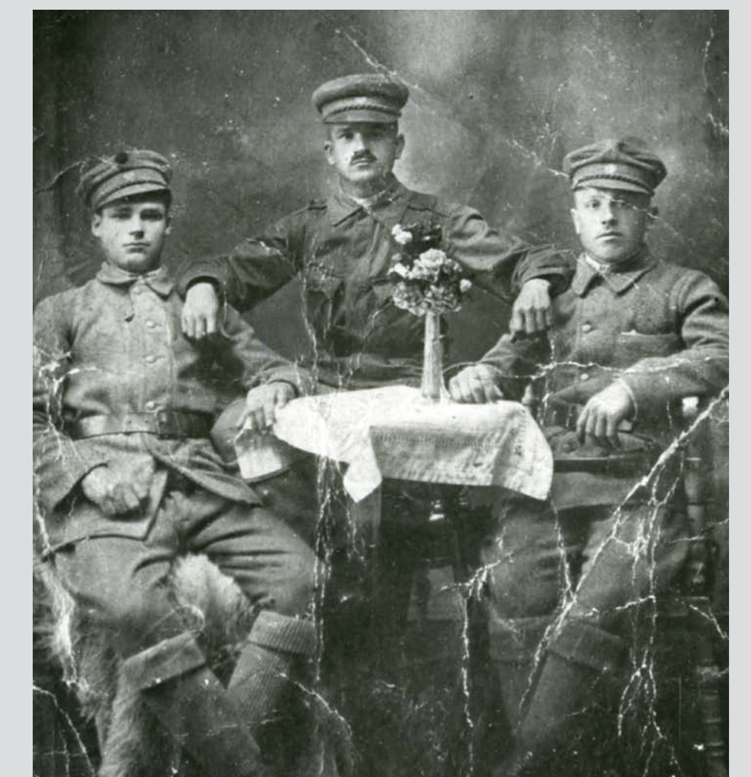
A 33. gyalogezred katonái Kassán, 1919. június Soldiers of the 33rd Infantry Regiment in Kassa, June 1919