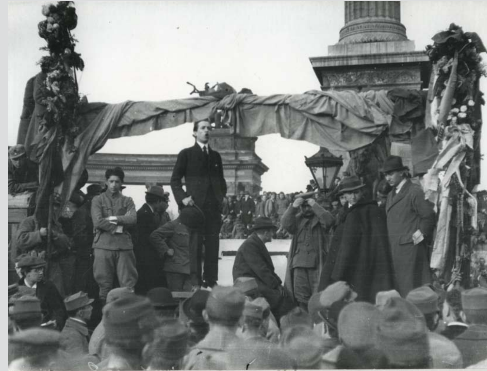
Szamuely Tibor beszél az 1919. április 6-án megtartott toborzógyűlésen, a Hősök terén Tibor Szamuely's speech at a recruitment rally in Heroes' Square. Budapest, 6 April 1919