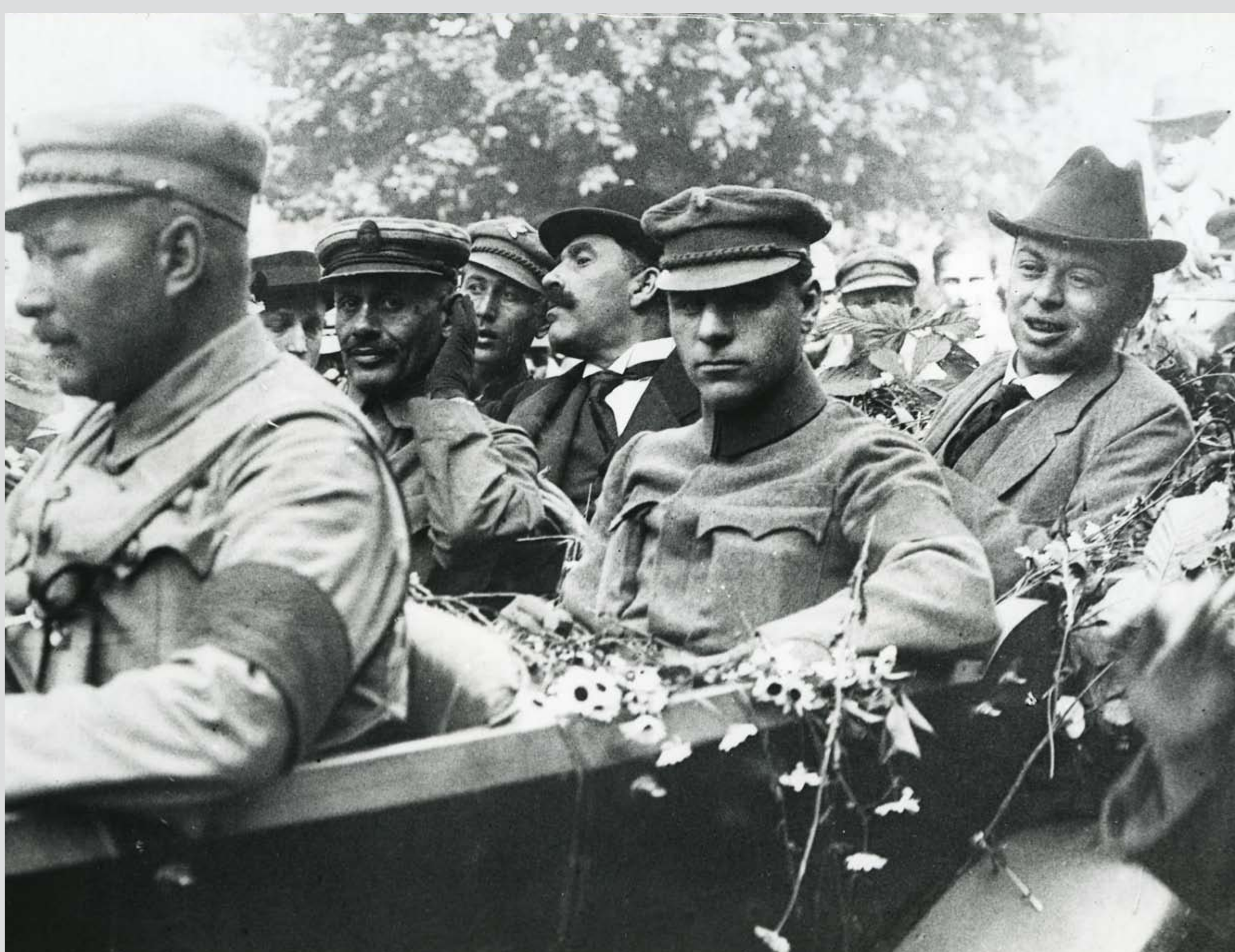
Népbiztosok autója Kassán. Kesztyűben Böhm Vilmos, mellette Szántó Béla könyököl, az ő háta mögött Kun Béla. 1919. június 11. Commissars in Kassa: Vilmos Böhm (wearing gloves), Béla Szántó (leaning on his elbow) and Béla Kun (behind Szántó), 11 June 1919