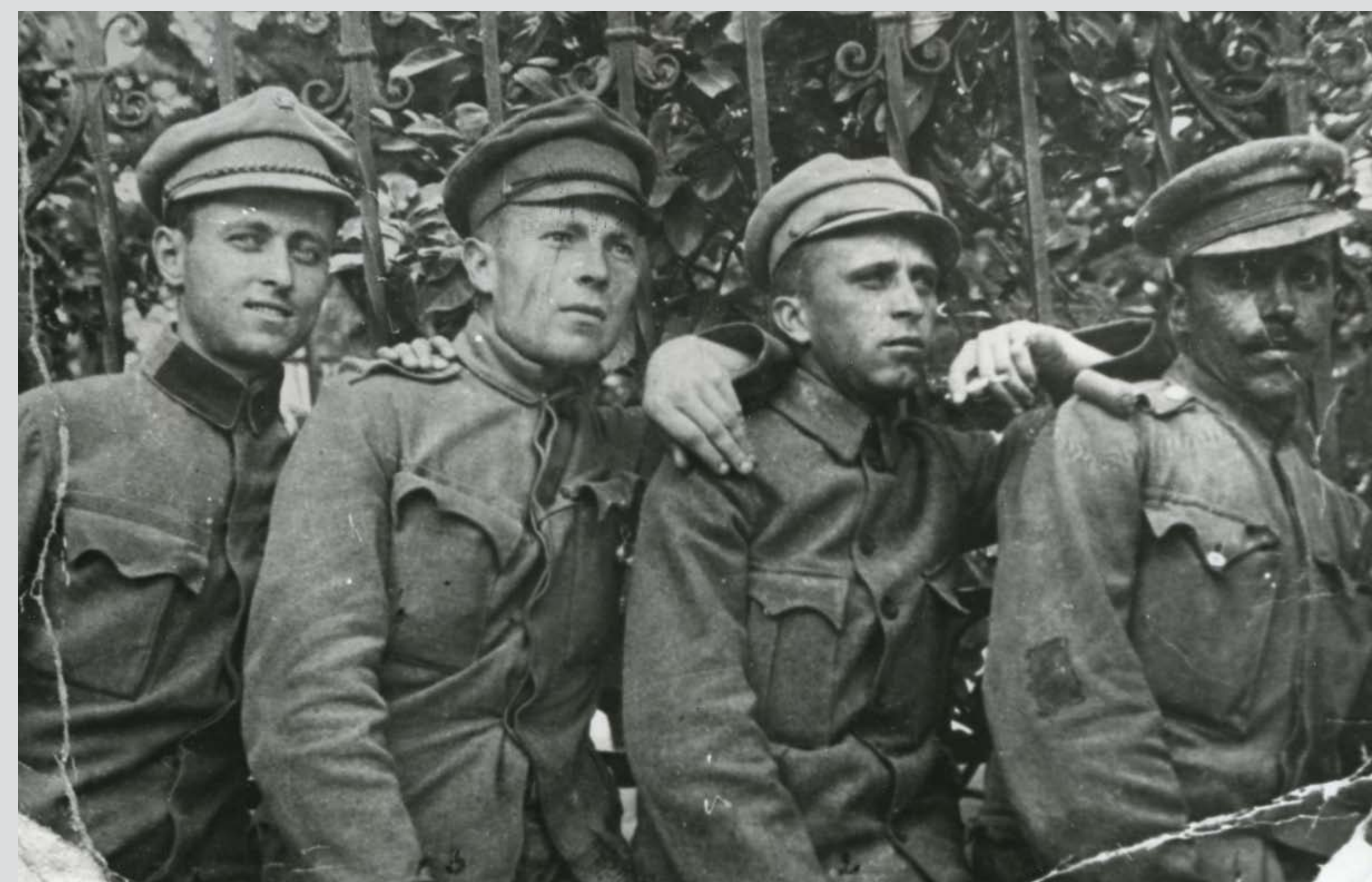
Békéscsabai vöröskatonák, 1919 Red soldiers from Békéscsaba, 1919