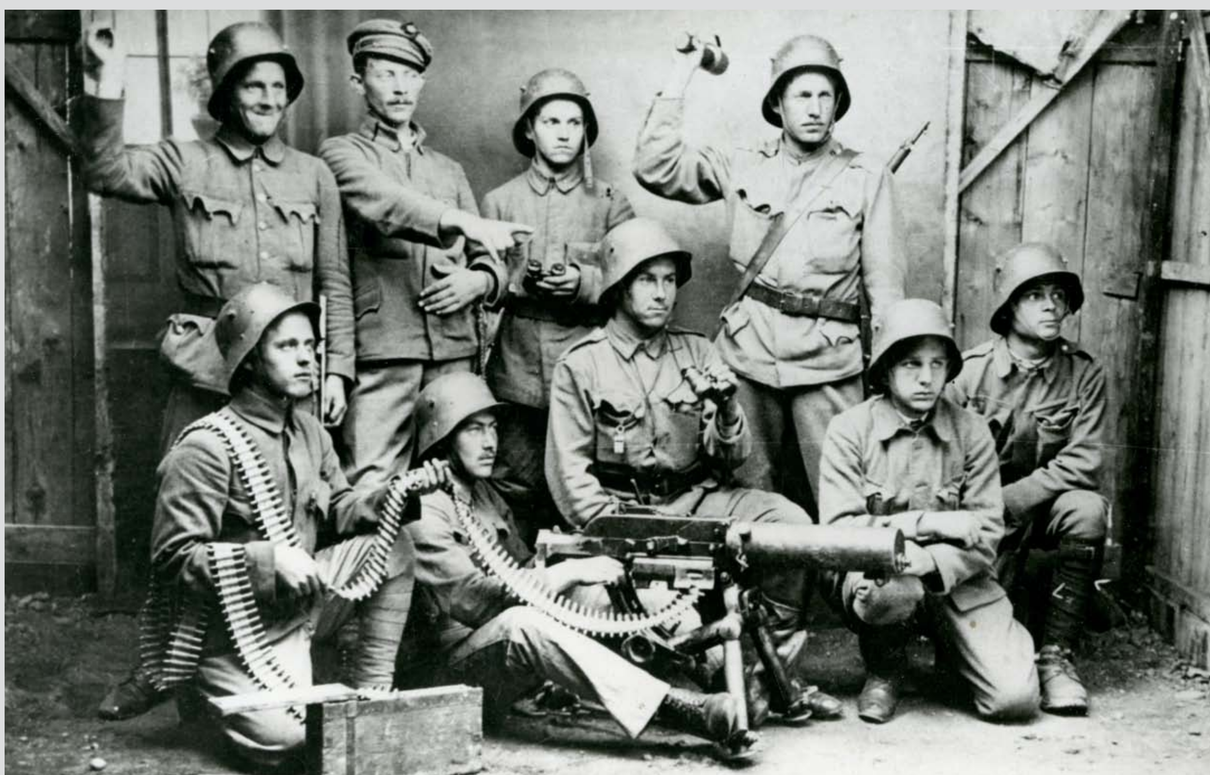
Salgótarjáni vöröskatonák géppuskás raja, 1919 Red soldiers' machine gun squad from Salgótarján, 1919