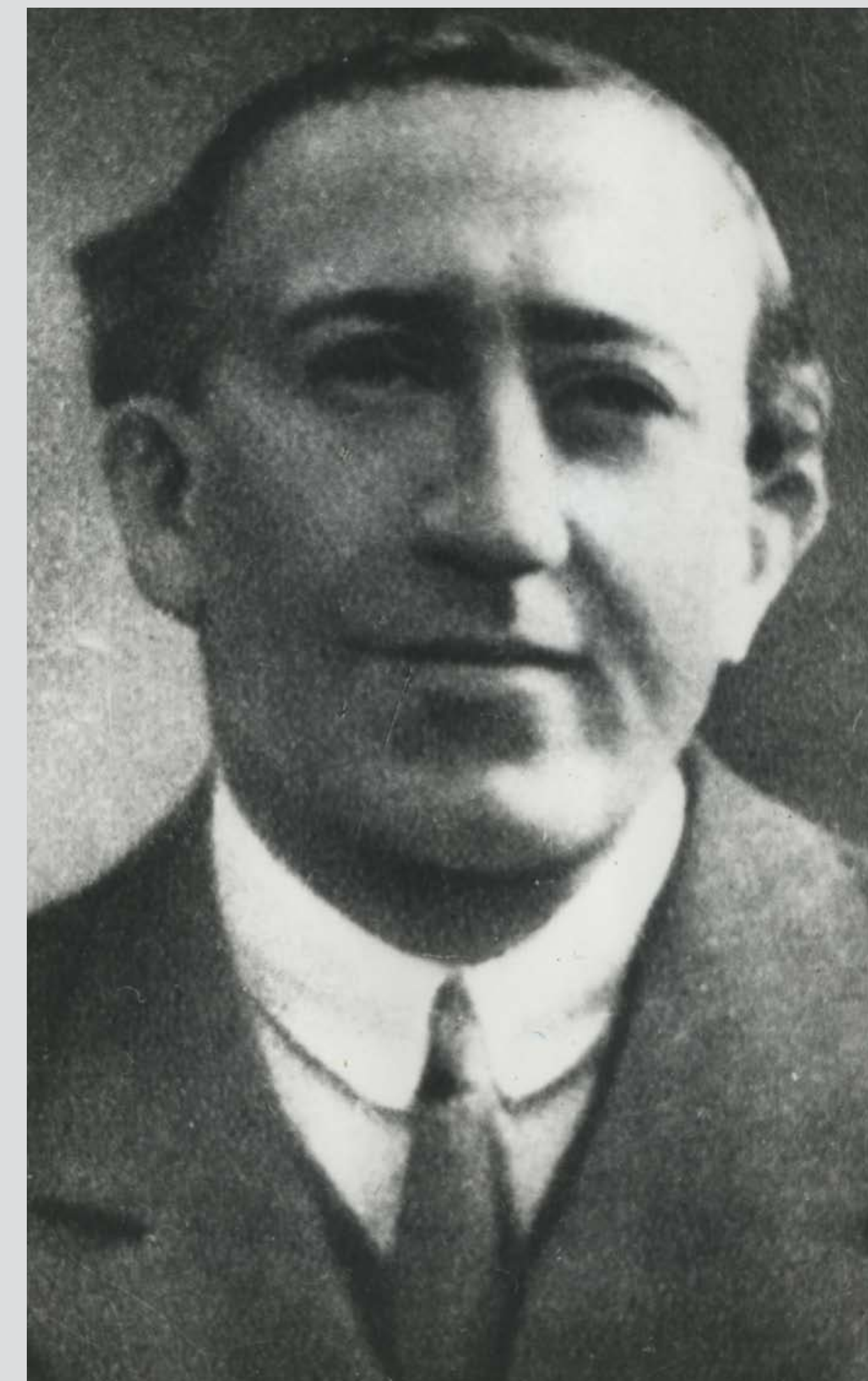
Pogány József kormánybiztos, a Katonatanács elnöke 1919. március 15-től és hadügyi népbiztos 1919. március 21. – 24. között Government Commissioner József Pogány, head of the Military Council from 15 March 1919, and Military Commissar between 21 and 24 March 1919