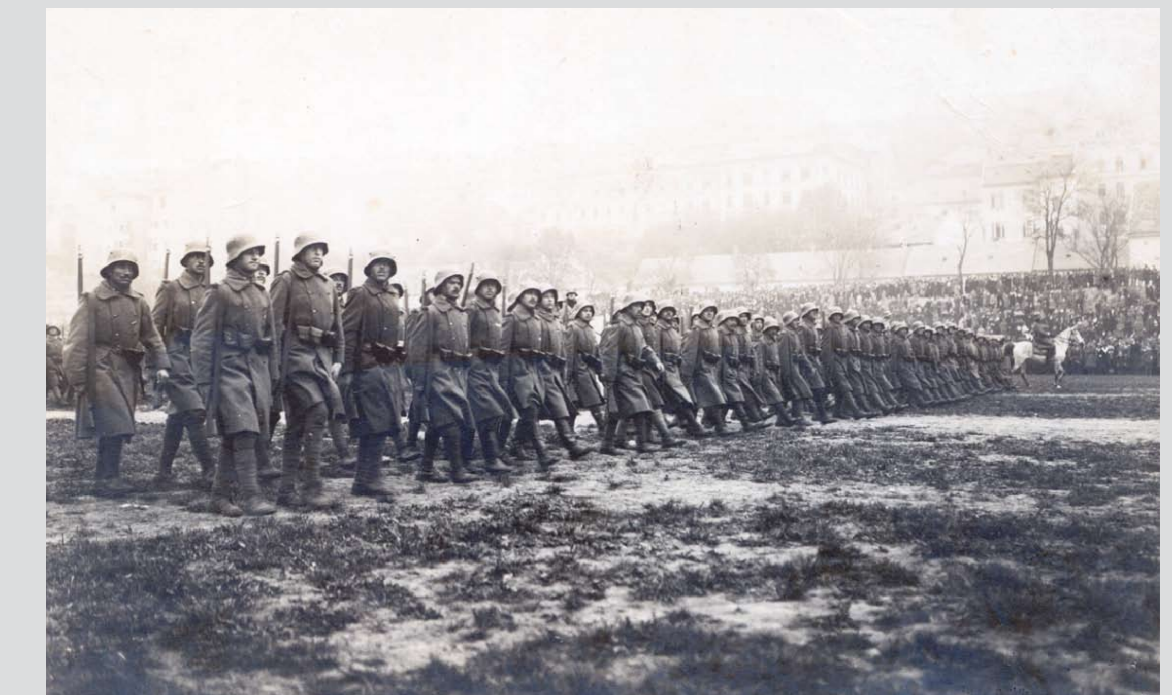
Csapat szemle a Vérmezőn. Budapest, 1920-as évek Troop inspection in Vérmező. Budapest, 1920s