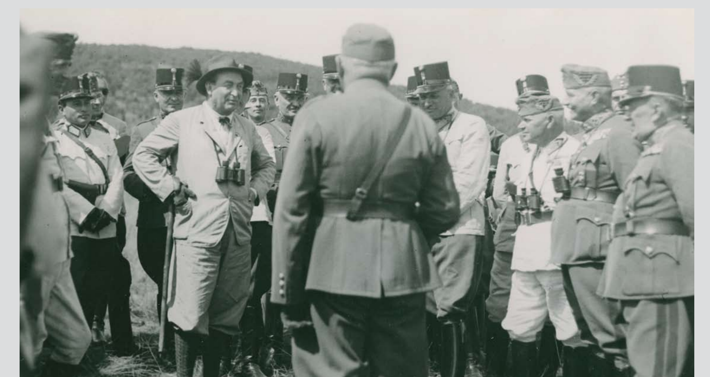
Gömbös Gyula miniszterelnök a Honvédség tábornokaival megszemléli egy aknavetővel végrehajtott bemutató lövészetet. Hajmáskér, 1936 nyara Prime Minister Gyula Gömbös with the Generals of the Hungarian Defence Forces inspecting a demonstration firing with mortars. Hajmáskér, summer of 1936