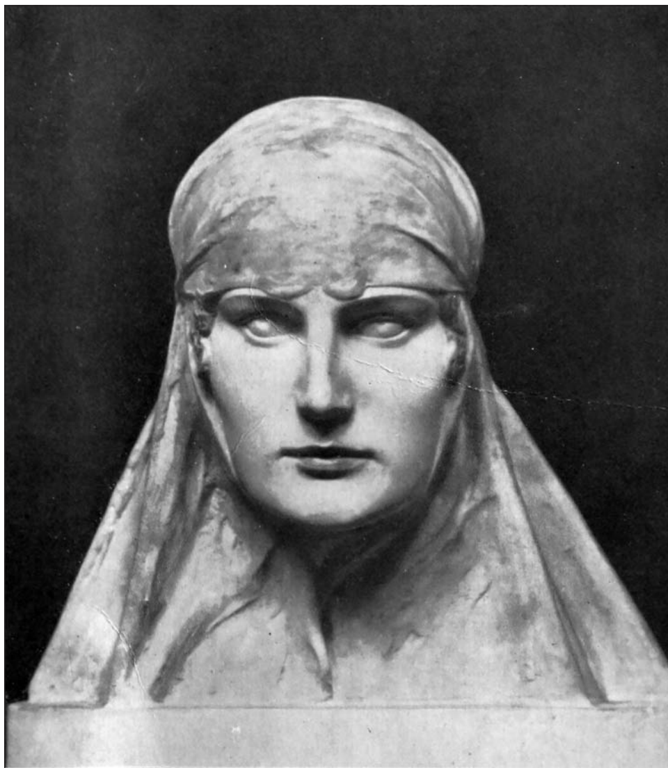
Ápolónő portréja 1918-ból (archív)