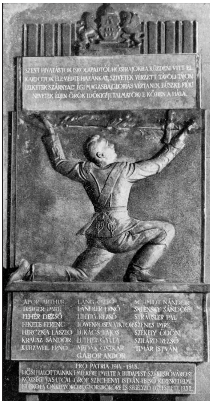
A Vas utcai Felsőkereskedelmi Fiúiskola hősi emlékműve (archív)