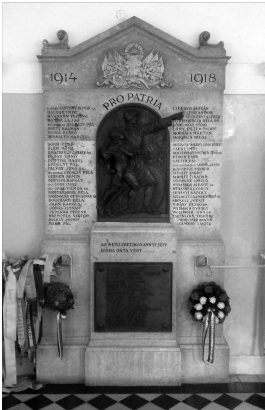
A Fasori Evangélikus Főgimnázium hősi emlékműve