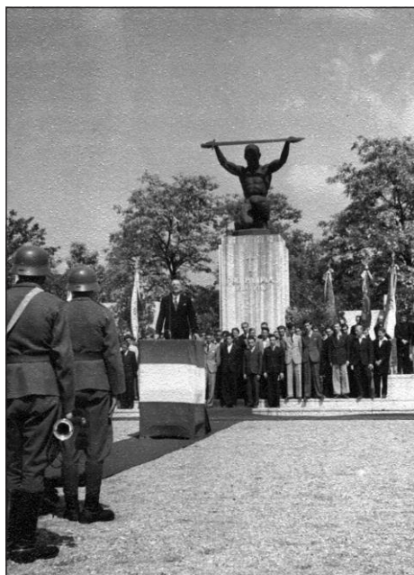
Katonai tiszteletadás a pestszenterzsébeti hősi emlékműnél