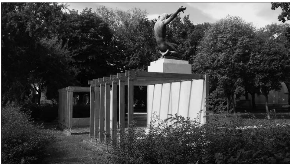
A pestszenterzsébeti emlékmű mai képe