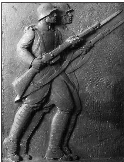
A bal oldali oldalfal egyik domborművének nagymintája (archív)