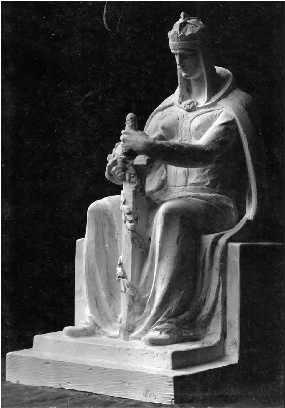
Az Országos Kaszinó hősi emlékművének terve