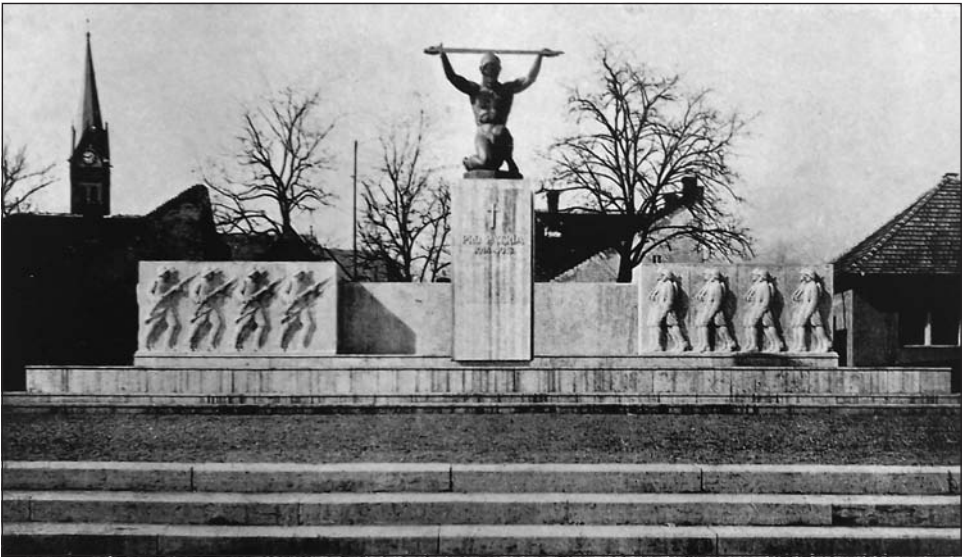
A pestszerzsébeti hősi emlékmű eredeti állapotában (archív)