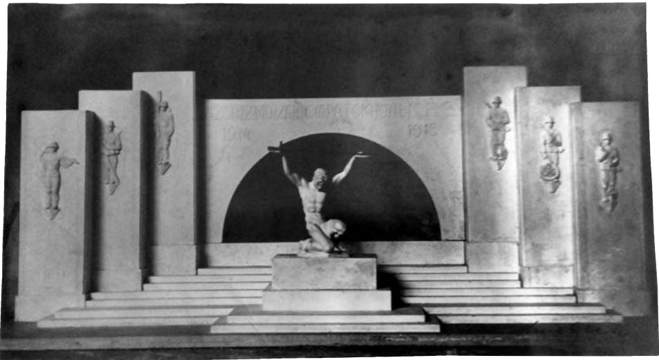
Lux Elek pályaműve a Műszaki csapatok hősi emlékművére (archív)