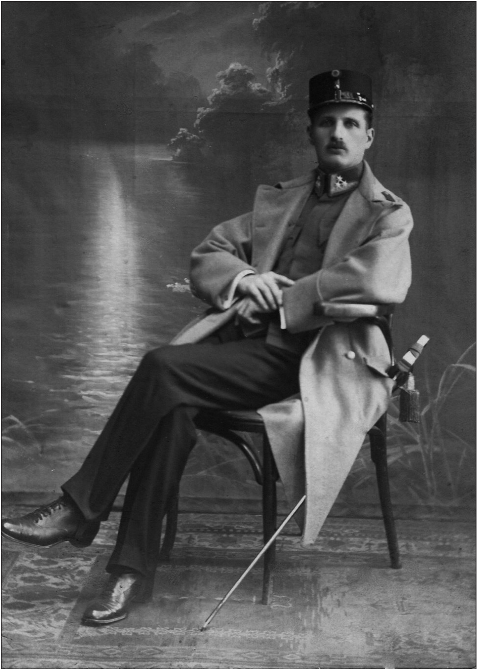
Lux Elek katonai egyenruhában (archív)