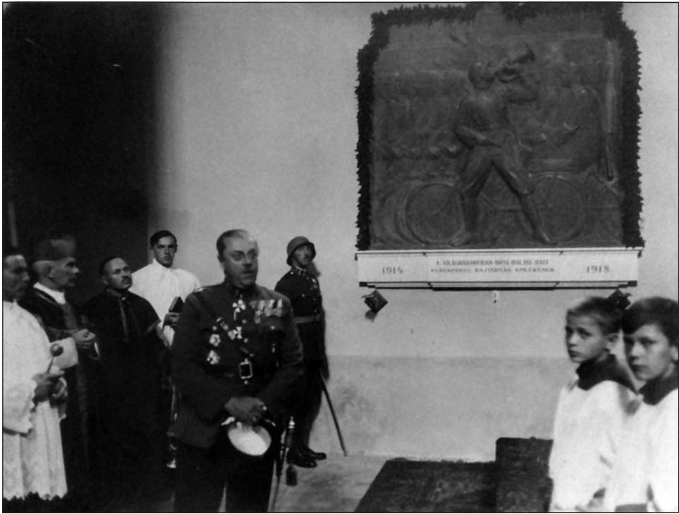
A Kerékpáros hősi emlék avatása a Helyőrségi templomban (archív)